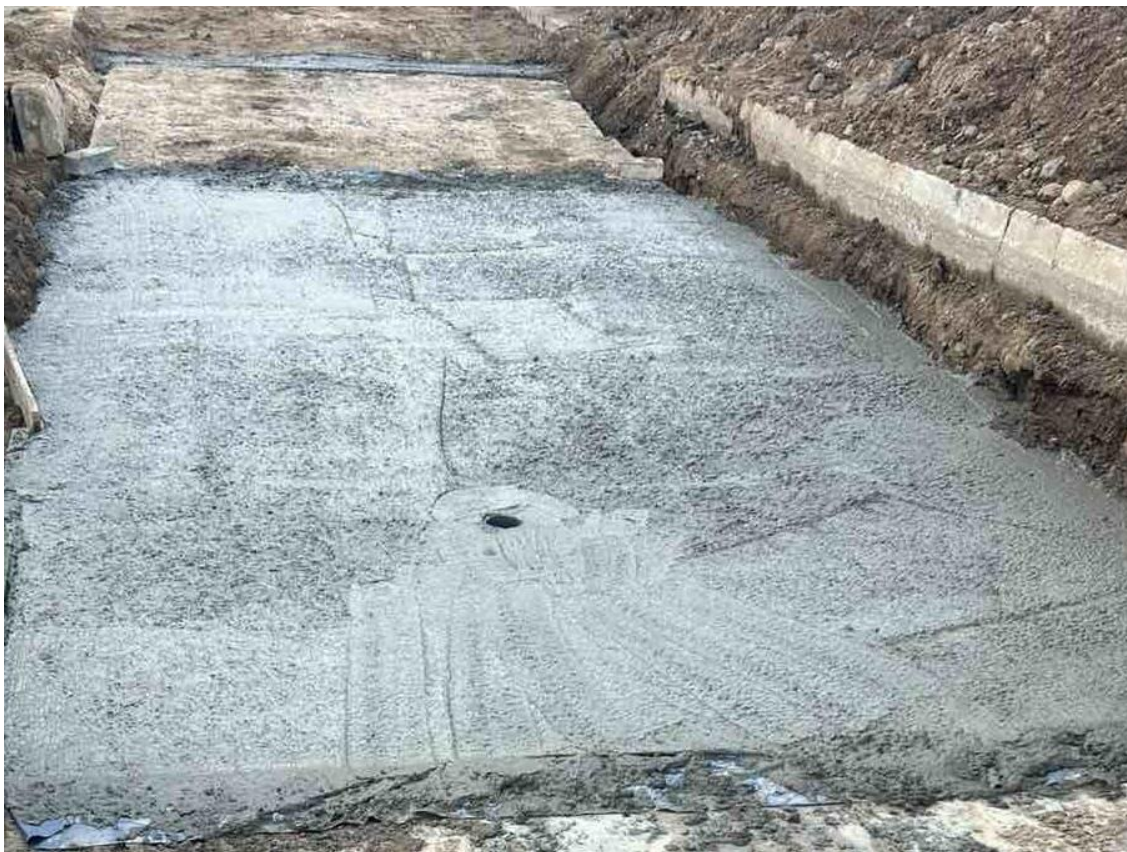
Строительная площадка объекта: "КАПИТАЛЬНЫЙ РЕМОНТ С МОДЕРНИЗАЦИЕЙ ЗДАНИЯ ГУО "ЯСЛИ-САД N 446 Г. МИНСКА" ПО УЛ. ПЛЕХАНОВА, 54"