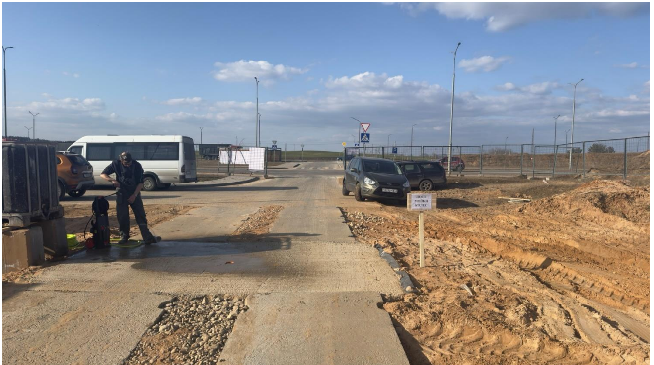
Строительная площадка объекта: ГОРОД-СПУТНИК СМОЛЕВИЧИ. КВАРТАЛ N2. ДЕТСКИЙ САД ПО ГЕНЕРАЛЬНОМУ ПЛАНУ N 19