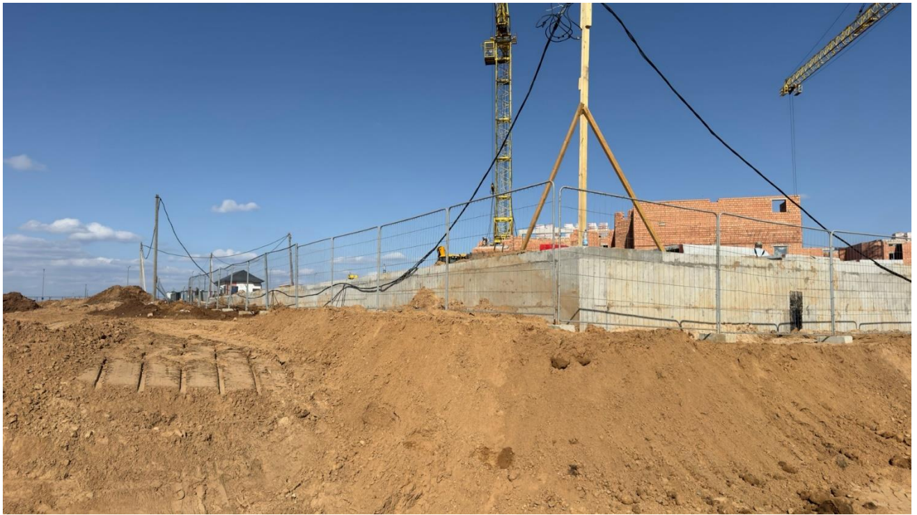
Строительная площадка объекта: ГОРОД-СПУТНИК СМОЛЕВИЧИ. КВАРТАЛ N2. ДЕТСКИЙ САД ПО ГЕНЕРАЛЬНОМУ ПЛАНУ N 19