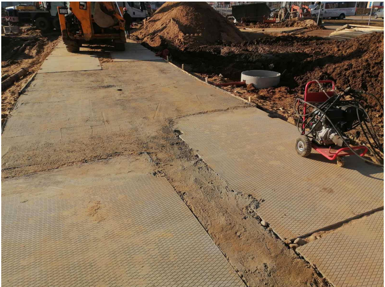
Строительная площадка объекта: МИКРОРАЙОН ЛОШИЦА-8.2. ДЕТСКОЕ ДОШКОЛЬНОЕ УЧРЕЖДЕНИЕ N11