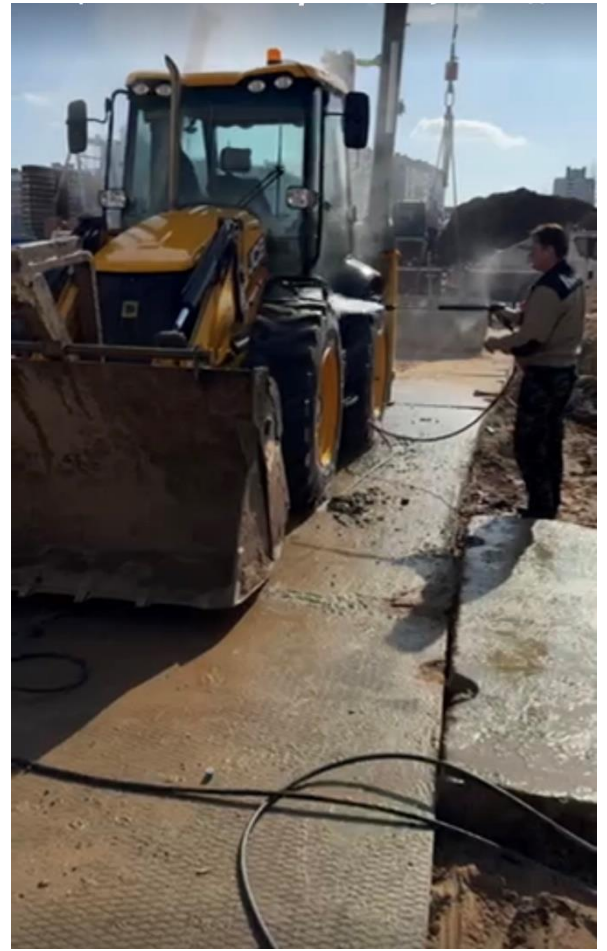
Строительная площадка объекта: МИКРОРАЙОН ЛОШИЦА-8.2. ДЕТСКОЕ ДОШКОЛЬНОЕ УЧРЕЖДЕНИЕ N11