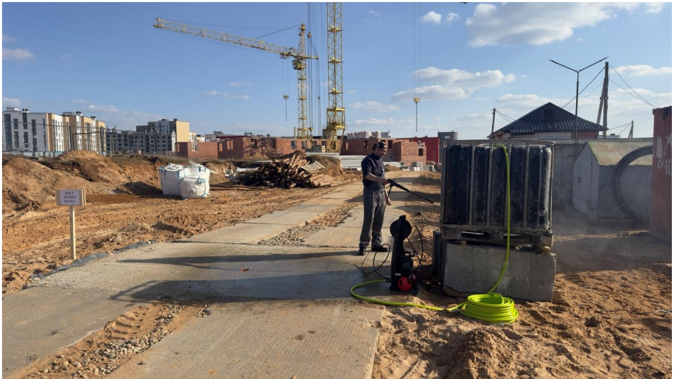
Строительная площадка объекта: ГОРОД-СПУТНИК СМОЛЕВИЧИ. КВАРТАЛ N2. ДЕТСКИЙ САД ПО ГЕНЕРАЛЬНОМУ ПЛАНУ N 19