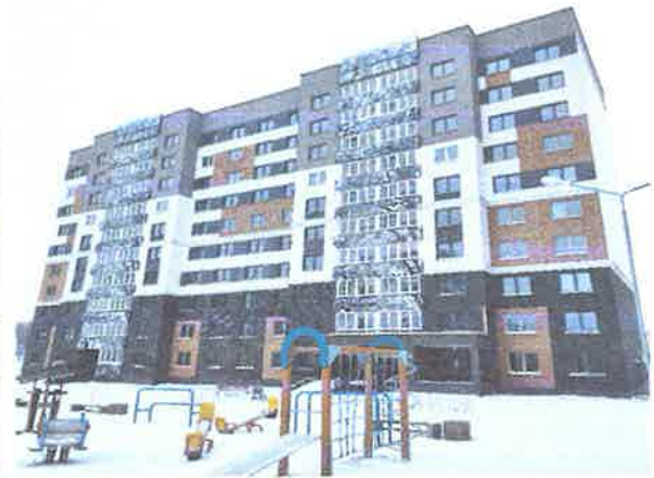
Рис. 3.1 Жилые дома на базе серии М464-У1