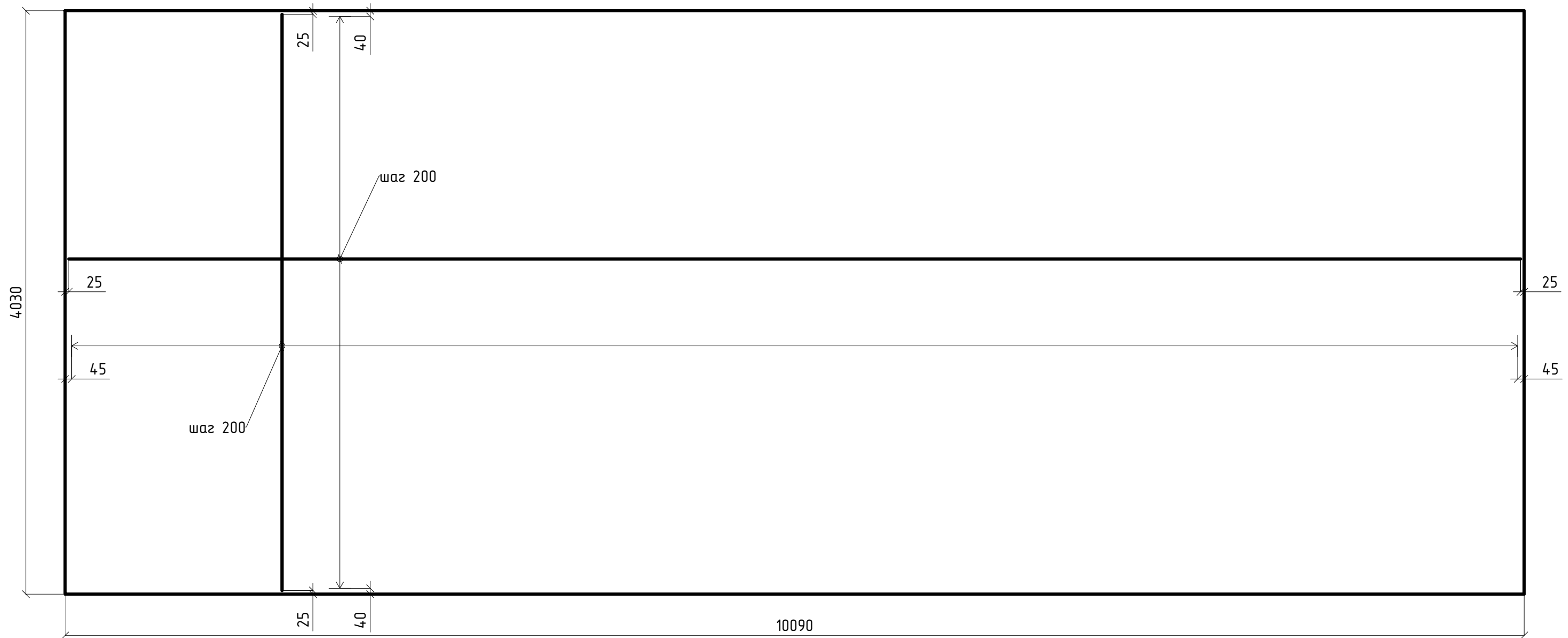
Схема расположения верхнего и нижнего армирования